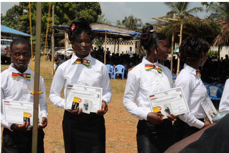
Bild 3: Fertig ausgebildete Lehrlinge in Kpalimé zeigen Ihre Urkunde

In Kpalimé werden bei AGERTO momentan Weber, Schreiner, Schweisser und Schneider ausgebildet. Außerdem gibt es Ausbildungsplätze für Friseur und Schnitzer. AGERTO zeichnet sich dadurch aus, dass nur ausschließlich bedürftige Jugendliche, Straßenkinder, Waisen oder verstoßene Frauen zur Ausbildung aufgenommen werden.